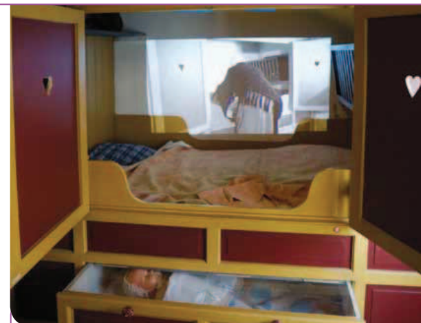
De nieuwe, deels digitale presentatie rondom 'bedstede en ondergeschoven kindje' in Streekmuseum De Acht Zaligheden.

Deze vraag staat niet op zichzelf. Meer streekmusea voelen eenzelfde dreigend verlies aan draagvlak: minder bezoekers, minder vrijwilligers, minder interesse in de collecties. Tijd om de bakens te verzetten? Veel streekmusea en lokale historische musea zijn in de jaren zestig en zeventig van de vorige eeuw opgericht. Die periode bracht veel aandacht voor de geschiedenis van het dagelijks leven en van 'de gewone man'. Het was de tijd waarin definitief afscheid werd genomen van het kleinschalige agrarische bestaan. Dit afscheid van een levenswijze maakte de voorwerpen die daaraan herinnerden waardevol. Mensen wilden dat verloren gegane bestaan van hun jeugd, hun ouders en grootouders documenteren. Deze wens kwam samen met een groeiende belangstelling voor de cultuur van de eigen streek. Heemkundigen gingen op zoek naar voorwerpen. En voorwerpen kwamen ook makkelijk beschikbaar: de aanschaf van nieuw, modern huisraad werd voor steeds meer mensen mogelijk en veel gereedschap uit ambacht en landbouw werd overbodig. De industrialisatie was nu immers volop in gang. Tot vandaag de dag vinden lokale historische musea nog regelmatig schenkingen op hun stoep. Een familielid is overleden en de nabestaanden doen hun best de erfenis een goede nieuwe bestemming te geven. Huisraad, kleding, gereedschap: kinderen en kleinkinderen willen het zelf niet hebben, maar om het nu zomaar naar de kringloopwinkel of de stort te brengen... Is dan het museum niet een veel betere plek?