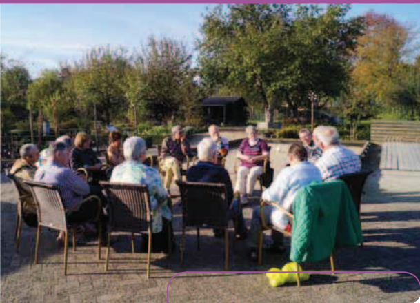
Medewerkers van Streekmuseum Jan Uten Houte in gesprek tijdens werksessies.

geveer de helft zonder betaalde krachten. De vrijwilligers hebben zich geschoold in het museumwerk en zien de opname in het Nederlands Museumregister, en dus het voldoen aan de norm, als een kroon op hun werk.