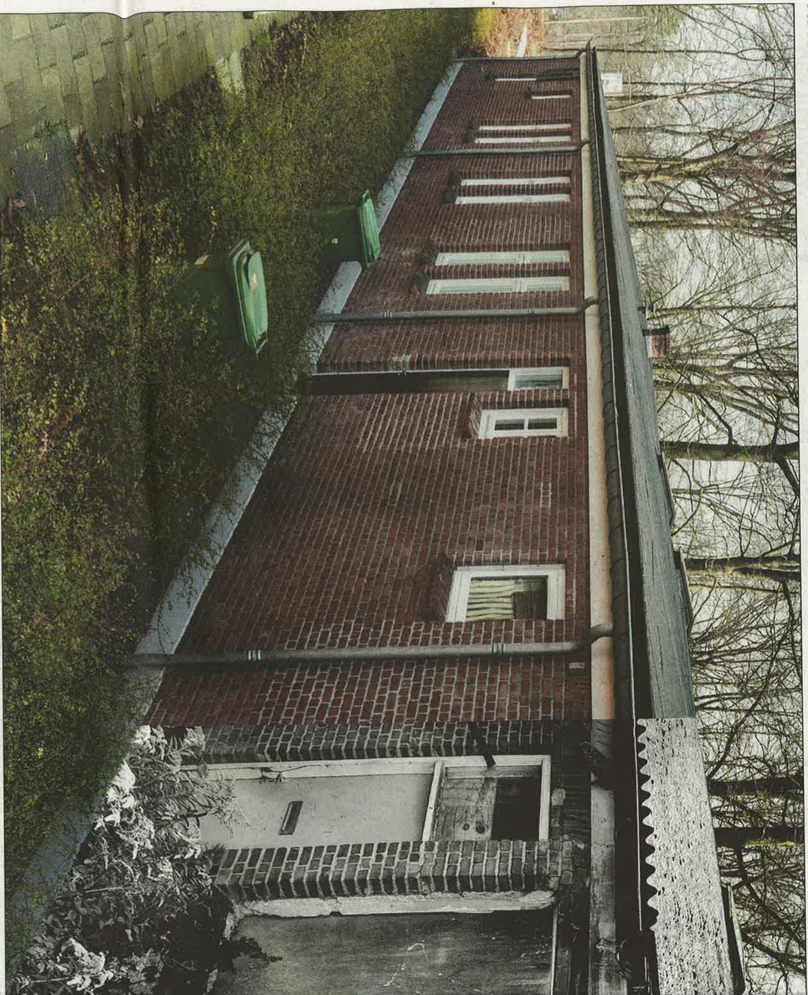
Barak 1B vroeger en nu. De enige bewaard gebleven barak van Kamp Vught is nog lang in gebruik geweest en daarna jarenlang verwaarloosd. In 2013 is hij gerestaureerd.